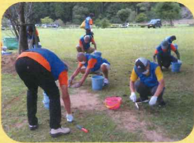
外来種の除草作業

と き 2022年9月18日(日) (19日は台風接近により中止) ところ 一乗谷朝倉氏遺跡唐門前