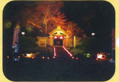
朝倉氏遺跡唐門ライトアップ